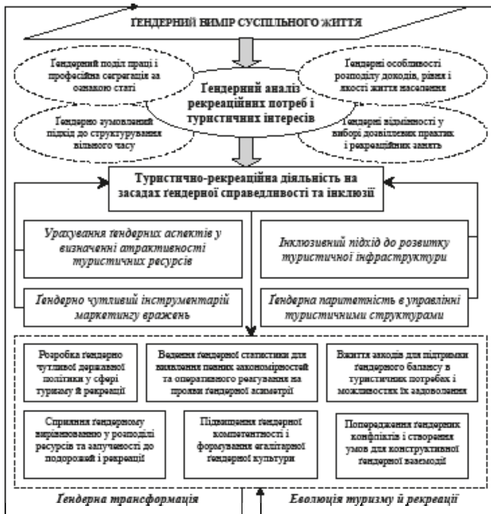
Рис. 5. Передумови і загальні напрями впровадження гендерно чутливого підходу до сфери туризму й рекреації

На рівні окремих суб'єктів господарської діяльності важливо зосередитись на: створенні безпечного та сприятливого робочого середовища для усіх працівників туристичної індустрії; постійному підвищенні рівня гендерної компетентності персоналу з метою відмови від гендерно-дискримінаційних практик, попередження гендерно-рольових конфліктів і застосування прийомів конструктивної гендерної взаємодії (зокрема, під час заходів тимблдингу, «мозкового штурму» тощо); виробленні власної гендерної політики з належним психологічним супроводом; впровадженні гендерно чутливого підходу до управління туристичним продуктом, який враховує уподобання, інтереси та неповторний досвід кожного туриста й рекреанта.