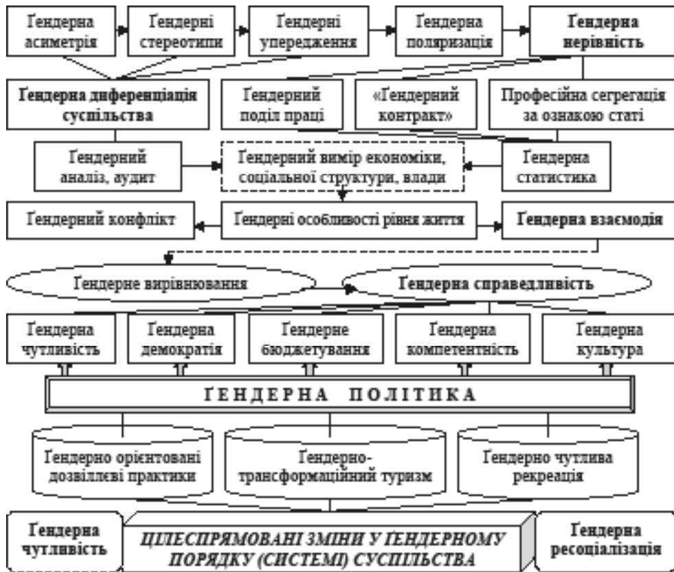
Рис. 2. Понятійний апарат гендеру: передумови виникнення у суспільстві гендерної нерівності та напрями її подолання через інноваційні підходи до організації дозвілля і туристично-рекреаційної діяльності