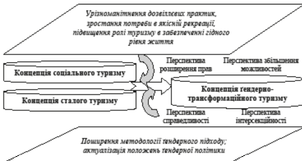
Рис. 1. Гендерно-трансформаційний туризм як поєднання базових ідей концепції сталого розвитку, соціального туризму і гендерного підходу