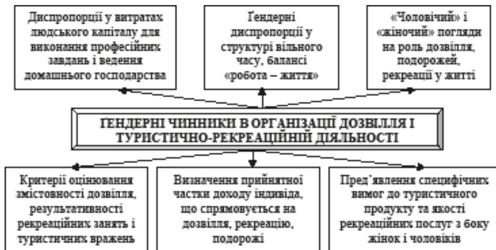
Рис. 3. Основні чинники, що формують гендерний контекст туристично-рекреаційної діяльності