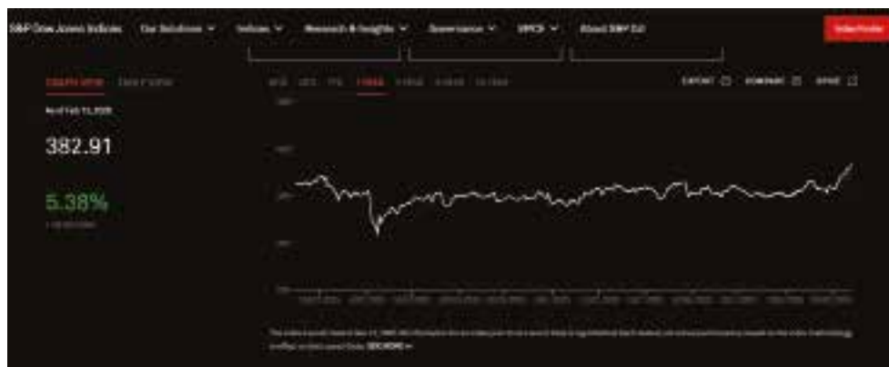
Рис. 3 Динаміка індексу S&P United States REIT за рік (лютий 2025 – лютий 2026).

Висновки. В умовах затяжного військового конфлікту та безпрецедентного масштабу руйнувань фінансова система України зазнає глибинних трансформацій. Проведений аналіз динаміки капітальних інвестицій за 2017–2024 роки засвідчив зміну пріоритетів ринку нерухомості: відбулася структурна переорієнтація з житлового будівництва на відновлення стратегічно важливих інженерних споруд та нежитлових об'єктів, що зумовлено потребами воєнної логістики та промисловості. Водночас житловий сектор демонструє високу адаптивність, зміщуючи вектор споживчого попиту в бік енергоефективності, автономності та фізичної безпеки об'єктів. На відміну від ринку нерухомості, що зберігає інерційність та залежність від фізичного збереження активів, фондовий ринок України фактично перейшов у режим функціонування ринку державного боргу. Домінування військових облігацій стало ключовим інструментом