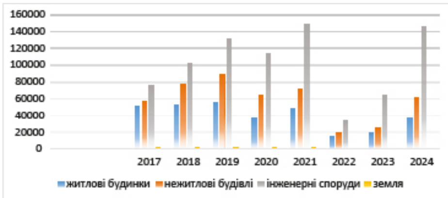
Рис. 2 Структура і динаміка капітальних інвестицій в житлові та нежитлові будівлі, інженерні споруди і землю за 2017–2024 рр., млн. грн.