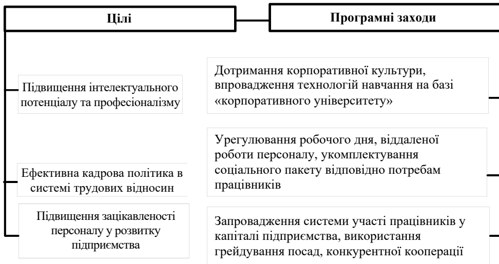
Рис. 4. Цілі та програмні заходи забезпечення кадрової безпеки підприємства