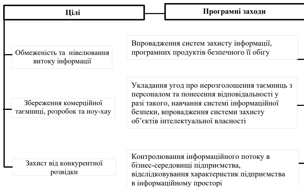
Рис. 3. Цілі та програмні заходи забезпечення інформаційної безпеки підприємства

Кадрова безпека. Об'єктами такої безпеки є не тільки безпосередньо персонал підприємства, але й система наявних трудових відносин, організована система оплати праці, участь працівників у капіталі. Цілями її забезпечення є: а) підвищення інтелектуального потенціалу та професіоналізму працівників завдяки застосуванню відповідної корпоративної культури, впровадження технологій навчання на базі «корпоративного університету»; б) ефективна кадрова політика в системі реалізації трудових відносин, що потребує впровадження таких програмних заходів, як урегульованість робочого дня, віддалена робота персоналу, система надання соціального пакету; в) підвищення зацікавленості персоналу у розвитку підприємства через участь працівників у капіталі, використання сучасних технологій мотивування та стимуляційних заходів (рис. 4).