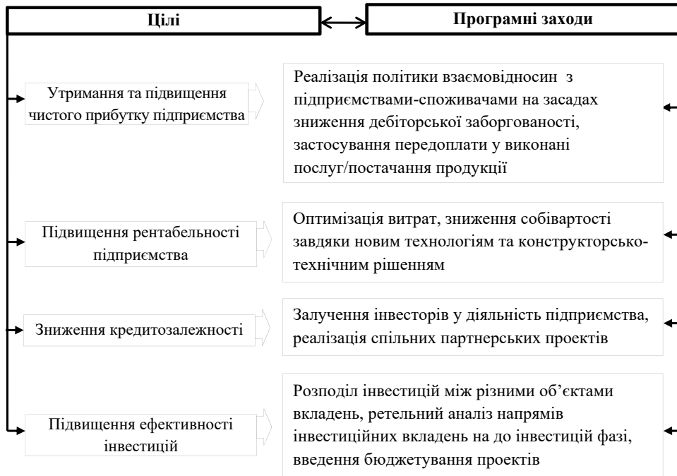
Рис. 1. Цілі та програмні заходи забезпечення фінансової безпеки підприємства

підприємства. Об'єктами техніко-технологічної безпеки стають фактори виробництва технічного та технологічного змісту. Цілями забезпечення техніко-технологічної безпеки є надання послуг чи виробництво продукції належного рівня якості, безперебійність процесу виробництва, будівництва, створення продукції, енергоощадливість обладнання та технологій (рис. 2). Тому програмними заходами є списання застарі-