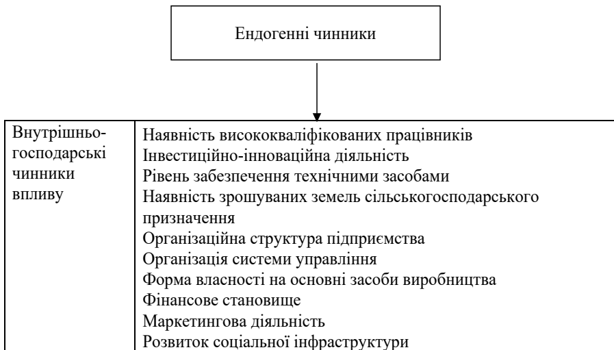
Рис. 2. Класифікація ендогенних чинників впливу на формування конкурентних переваг сільськогосподарських підприємств у Херсонській області