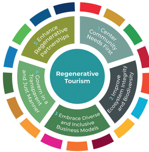
Рис. 2. Принципи регенеративного туризму за версією Chloe King

нагрівається, а дика природа втрачається із загрозливою швидкістю. Кожен із п'яти принципів натхненний природними рішеннями та спрямований на те, щоб спрямувати туристів-практиків у регенераційному переході. Принципи підкреслюють, що туризм більше не можна «робити» для місцевих громад; це має бути зроблено «з ними і для них».