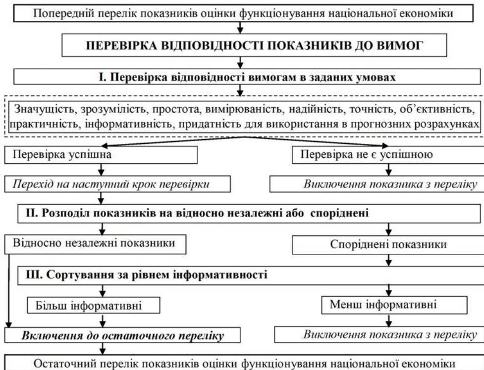
Рис. 1. Логічна модель формування остаточного переліку показників оцінки функціонування національної економіки

Значимість показника конкурентоспроможності з точки зору управління національною економікою є вкрай високою, адже спираючись на нього, можна відокремити перелік факторів, що негативно впливають на ведення бізнесу в країні [6, с. 18], визначити напрямки підвищення конкурентоспроможності країни в умовах глобалізації [7].