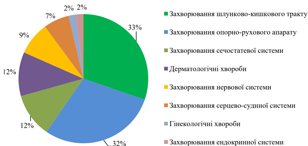
Рис. 2. Лікувально-оздоровча спеціалізація курортів України, %