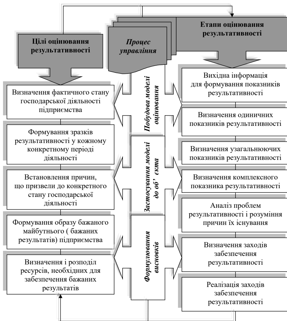
Рис. 1. Підхід до оцінювання результативності діяльності підприємства

визначив два ключових питання, що пов'язані із адекватністю обраного напрямку руху підприємства. Перше з цих питань полягає у тому, наскільки раціонально вирішується проблема (чинник продуктивності). Друге, не менш важливе, питання – пов'язане із відповіддю про необхідність вирішення даної проблеми (чинник цінності результату). Будь-які відповіді на ці питання передбачають чотири типи ситуацій: робиться не те і не так; блискуче робиться те, що робити не потрібно; робиться те, що необхідно, але з великими перевитратами ресурсів; робиться правильно те, що дійсно потрібно робити.