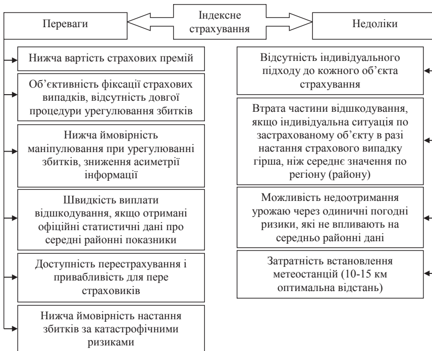
Рис. 3. Переваги та недоліки індексного страхування