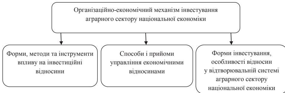
Рис. 1. Складові організаційно-економічного механізму інвестування аграрного сектору [8]

Організаційно-економічний механізм інвестування як категорія є сукупністю економічних інструментів і методів регулювання, що забезпечують максимальну ефективність використання капіталу за зовнішніх та внутрішніх постійно змінюваних умов інвестиційного ринку [8]. Складові організаційно-економічного механізму інвестування аграрного сектору економіки відображено на рис. 1.