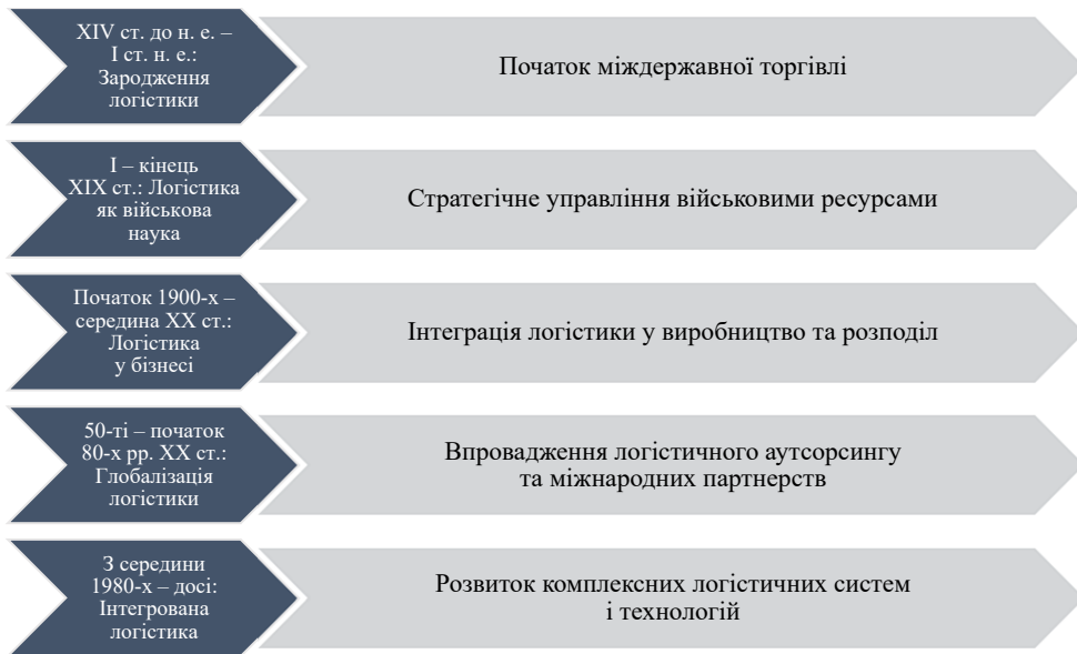
Рис. 1. Хронологія розвитку логістики як інструменту ринкової економіки

– Перший етап (XIV ст. до н. е. – I ст. н. е.). У цей час логістика зароджувалася, фокусуючись на переміщенні товарів в межах і між державами. Це був період, коли логістика почала формувати основи для міжнародної торгівлі, сприяючи розвитку економік за допомогою ефективного руху товарів.