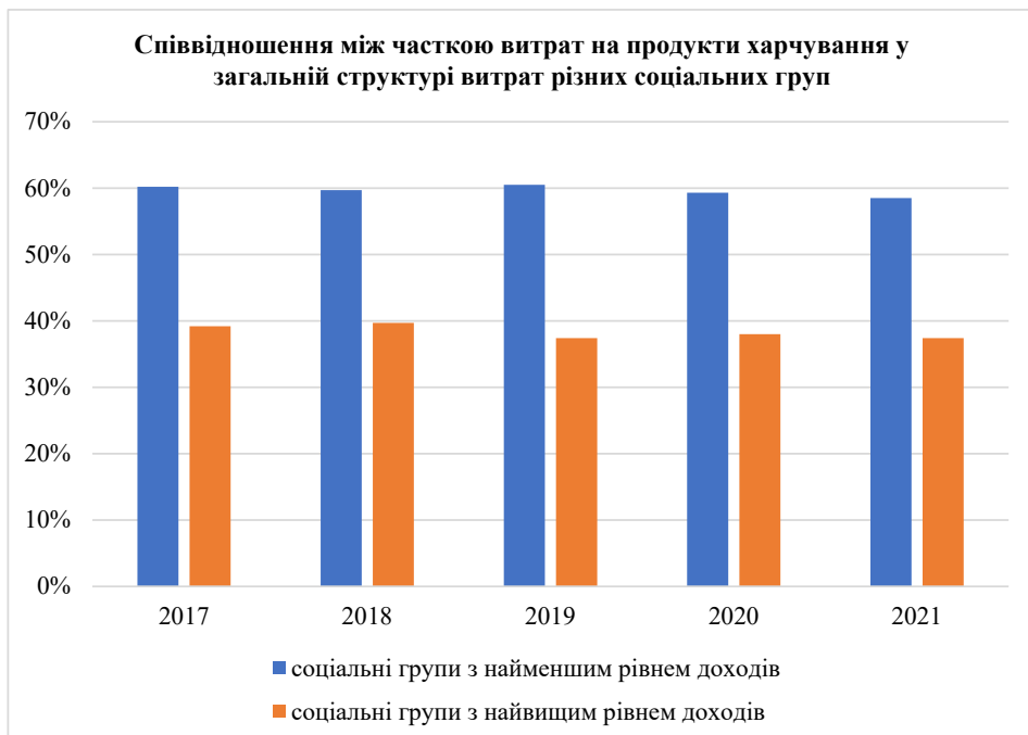
Рис. 3. Співвідношення між часткою витрат на продукти харчування у загальній структурі витрат різних соціальних груп, %

З огляду на це, підкреслимо, що домогосподарства, що мають найвищий рівень доходів, витрачають на продукти харчування значно менше, аніж ті, що мають найнижчий рівень доходів. Враховуючи це, стан продовольчої безпеки України у даному контексті не є позитивним, адже показник диференціації та відмінність у частках витрат на продукти харчування є значними.