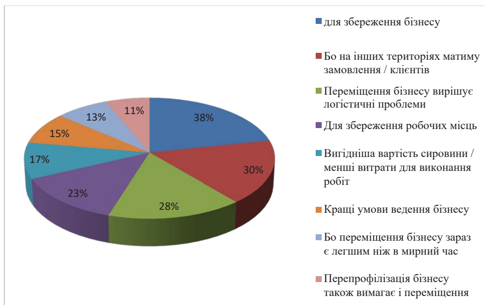
Рис. 3. Причини переміщення бізнесу