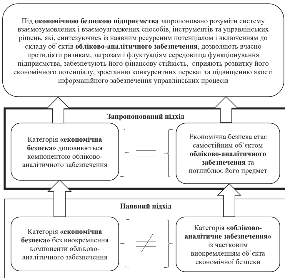
Рис. 1. Дефінітивна логіка поглиблення сутності економічної безпеки компонентою обліково-аналітичного забезпечення