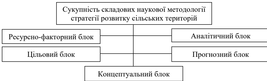
Рис 1. Структурний зміст методології здійснення стратегії розвитку сільських територій

Вибрані напрями і сценарії цілей стратегії знаходять своє відображення у відповідній конструкції (рис 1).