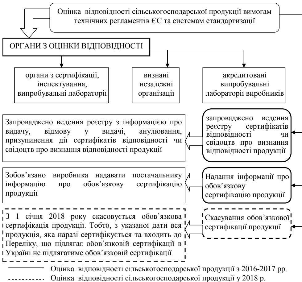
Рис. 2. Оцінка відповідності сільськогосподарської продукції вимогам технічних регламентів ЄС та системам стандартизації

Передбачається, що проведення оцінки відповідності може бути як добровільним, так і обов'язковим. Добровільна оцінка відповідності здійснюється в будь-яких формах, включаючи випробування, декларування відповідності, сертифікацію та інспектування, та на відповідність будь-яким заявленим вимогам.