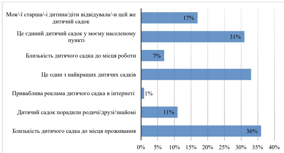
Рис. 2. Розподіл відповідей батьків (законних представників) дітей щодо причин вибору закладу дошкільної освіти

Виходячи з цього, до основних внутрішніх факторів, які приводять до зростання якості освітніх послуг, підвищення доходу та прибутку ПЗДО, ми відносимо покращення матеріально-технічного забезпечення та кваліфікації персоналу, високу якість харчування, наявність додаткових послуг (наприклад, збирання дітей із дому), графік роботи (наявність цілодобових груп), використання інноваційних технологій та сучасних методів навчання, покращення психологічного клімату та взаємодії із батьками.