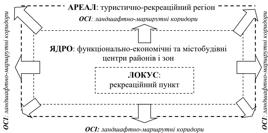
Рис. 1. Композиційні типи елементів туристично-рекреаційних систем, що використовуються у процесі туристичного районування

Проектування туристично-рекреаційних систем у регіонах базується на виділенні різних композиційних, функціональних і планувальних елементів [11, с. 437]. Серед таких елементів доцільно виділити композиційні типи: ареали (тотожні поняттю рекреаційного регіону); ядра – функціонально-економічні та містобудівні центри районів і зон; осі – ландшафтно-маршрутні коридори, що зв'язують між собою ареали і ядра в єдиний територіальний каркас; локуси (тотожні поняттю рекреаційного пункту). Наведені понятійно-термінологічні визначення є відносно впорядкованою системою щодо об'єктів рекреаційного районування та їх структуризації [7, с. 164] (рис. 1).